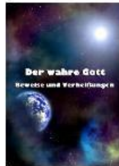
Der wahre Gott - Beweise und Verheißungen