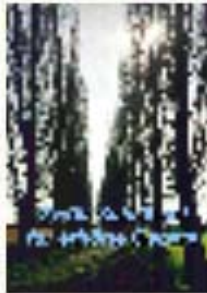
Zwölf Schlüssel für erhörte Gebete