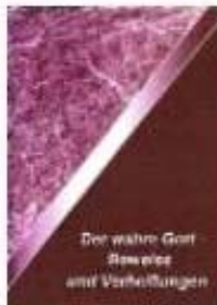
Der wahre Gott - Beweise und Verheißungen

Um unsere Broschüren und Artikel kostenlos und unverbindlich zu bestellen, wenden Sie sich bitte an eine der genannten Kontaktadressen.